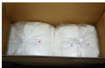
2重包装（個包装×25×2大袋）