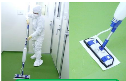
薬剤を素早く吸収し、滑りよくスムーズに塗布できます。