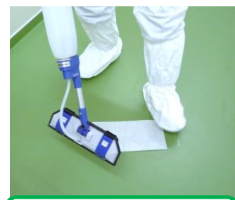
使用後は足で抑えて簡単に取り外せます。