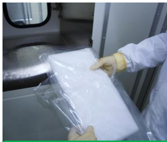
外袋を取り除いて上の清浄グレードへ持ち込みます