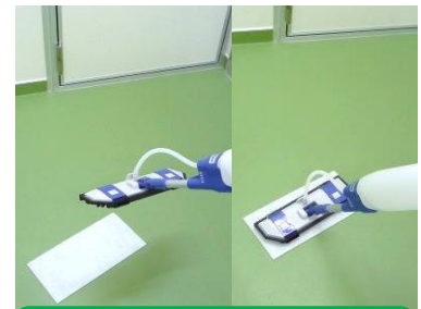
市販の薬剤塗布器のマジックテープに簡単に装着できます